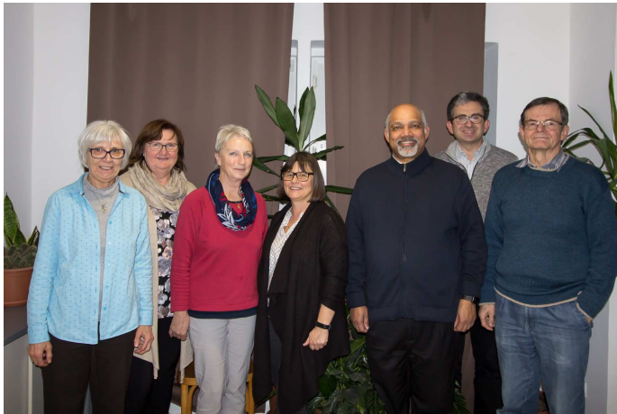
Krankenkommunionsspenderinnen und Krankenkommunionsspender der Pfarre Langenhart

„Vielleicht sind Sie zur Zeit krank, oder Sie können aus Altersgründen nicht mehr zur Sonntagsmesse kommen. - Oder Sie haben selbst jemanden in der Familie oder jemanden in ihrer Nachbarschaft, von dem Sie wissen, dass er oder sie nicht mehr in die Kirche kommen kann: Dann denken Sie bitte an die Möglichkeit der Krankenkommunion! Der Priester oder jemand aus der Pfarre, der für den Dienst beauftragt ist kommt zu Ihnen nach Hause, betet mit Ihnen und Sie haben die Möglichkeit die Kommunion zu empfangen. Stellen Sie sich vor, Sie könnten ein Medikament bekommen, das Ihnen ganz bestimmt hilft, -aber Sie verzichten darauf.